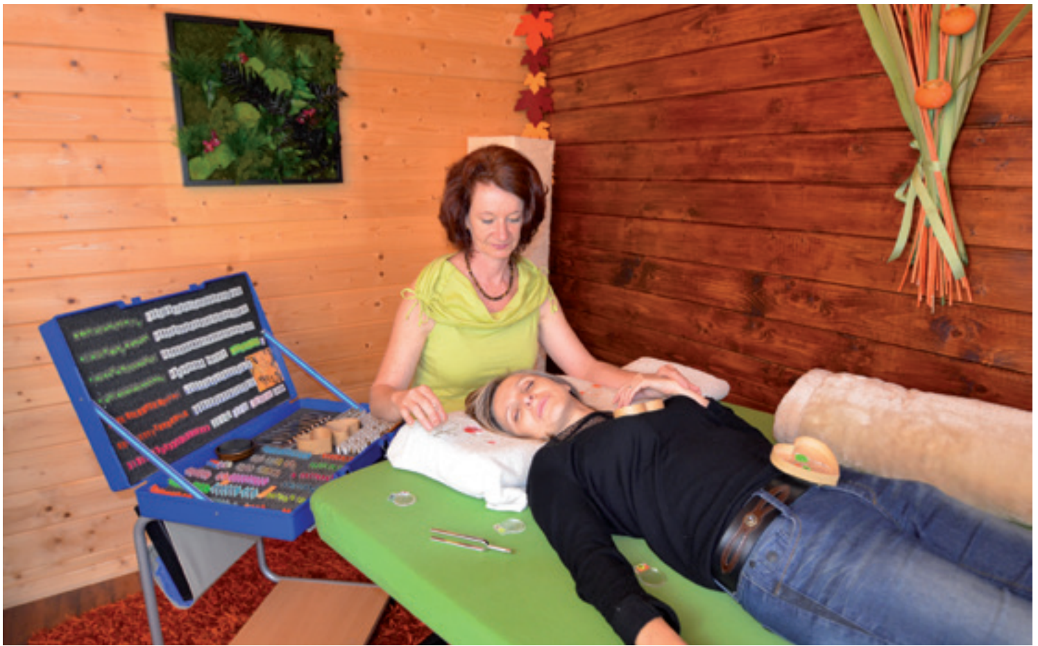
Concrètement, la «correction» des fréquences s'effectue à l'aide d'un ou de plusieurs diapasons.

successives qui l'ont menée là, et qu'est-ce qui au tout début a déstabilisé la personne?».